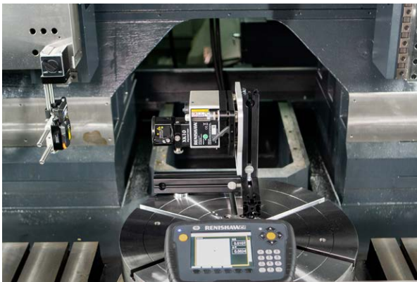
XK10 アライメントレーザーシステムによる直角度測定