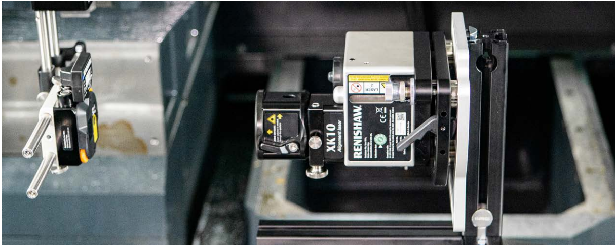
XK10 フィクスチャキットを使った柔軟なセットアップ

「最大測定長 30m の XK10 なら、長い軸を持つ機械の検査において我々が抱えていた課題も、1 台で解決できました。どの大きさの直角定規がいいのか、などと気にかける必要がなくなったので、軸の長い機械でも今後自信をもって生産にあたる事ができるようになりますし、人件費の大幅な圧縮にも効果が見込めます」