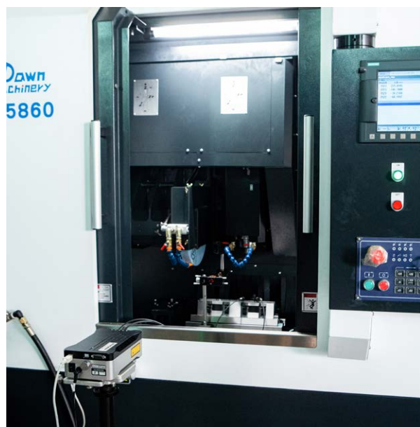
XL-80 レーザー干渉計システムによる動的精度チェックの様子 (対象: Dawn Machinery 社製工作機械)

特注工作機械の製造で成功を収めるには、細部への注意深さと効率の高さが求められる。組立て作業においては、誤差を短時間かつ正確に検出して補正する必要があり、同時に、労働コストも極限まで低く抑える必要がある。顧客からの引合いが増え続ける中 Dawn Machinery 社は、従来の直角定規とダイヤルインジケータを使った測定から、レニショーの XK10 アライメントレーザーシステムによる測定への切替えに踏み切った。