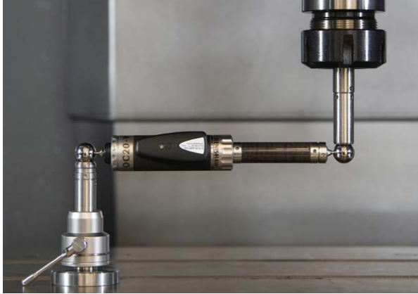
하트포드는 Renishaw의 QC20-W 볼바를 사용해 기계 위치 성능을 점검합니다