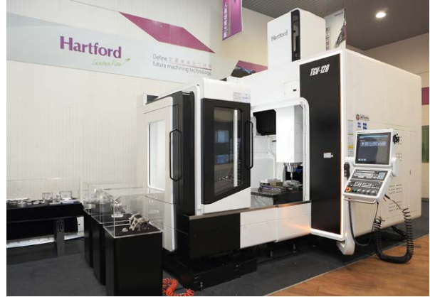
하트포드는 중간 규모부터 대규모까지 다양한 3-축 및 5-축 CNC 기계를 생산합니다

공작 기계의 정밀 조립과 배치 역시 매우 중요하며, 5-축 공작 기계는 \pm 6 \mu\text{m} 미만의 편차로 배치해야 합니다. 기계 위치와 함께 선형 및 각도 오차를 모두 측정하기 위해 Renishaw XL-80 레이저 간섭계가 사용됩니다. XL-80은 국제 표준에 준하는 파장을 갖는 매우 안정적인 레이저 빔을 생성합니다. 안정적인 고 정밀 레이저 광원과 정확한 환경 보정 덕분에 \pm 0.5 \text{ ppm} 의 리니어 측정 정확도를 보장합니다. 하트포드는 공작 기계의 X-축과 Y-축이 올바르게 매치되고 오차가 5 \mu\text{m} 미만으로 유지될 수 있도록 Renishaw QC20-W 볼바 측정 시스템을 사용해서 여러 작동 속도에서 교차 검증을 수행합니다.