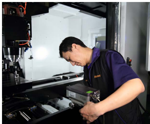
기계 캘리브레이션에 XL-80 레이저 간섭계를 사용하고 있는 하트포드 직원