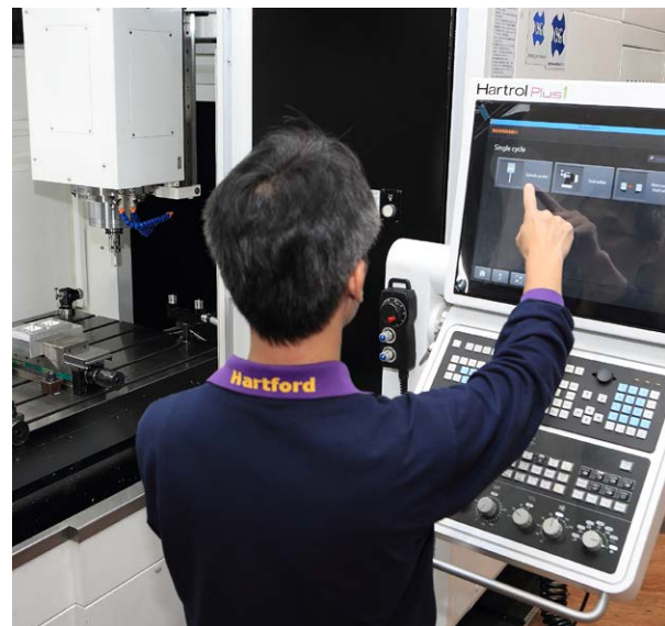
Hartrol Plus CNC 컨트롤러에 통합된 Set and Inspect 기계내 앱

하지만 ‘지능형 제조’와 ‘스마트 팩토리’라는 Industry 4.0 목표를 달성하기 위해서는 정확하고 효과적인 공정 제어 시스템이 필요합니다. 또한 사용법이 간단해야 하며 자체 교정을 지원하고 공정 변이 원인에 맞게 적응할 수 있도록 즉각적인 데이터를 충분히 제공해야 합니다.