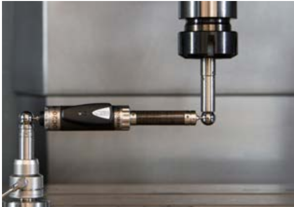
Hartford emplea el ballbar QC20-W de Renishaw para verificar el rendimiento de posicionamiento de la máquina