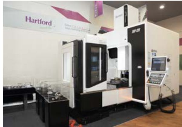
Hartford produce una gama completa de máquinas CNC de tamaño medio a grande, de tres y cinco ejes