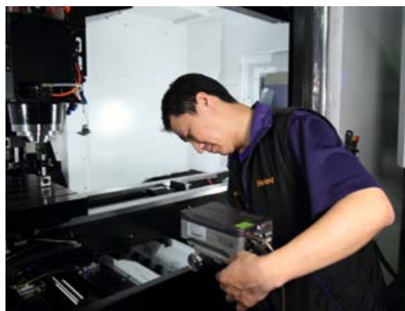
Empleado de Hartford con el interferómetro láser XL-80 para calibración de la máquina