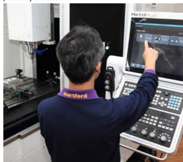
Aplicación Set and Inspect integrada en máquina con el control CNC Hartrol Plus

No obstante, para cumplir los objetivos de ‘fabricación inteligente’ de la Industria 4.0 y la ‘fábrica inteligente’, todavía son necesarios unos sistemas de control de procesos precisos y eficaces.