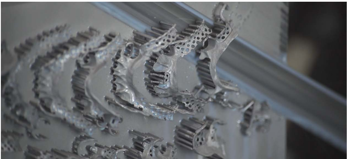
由建構基板移除的局部活動假牙