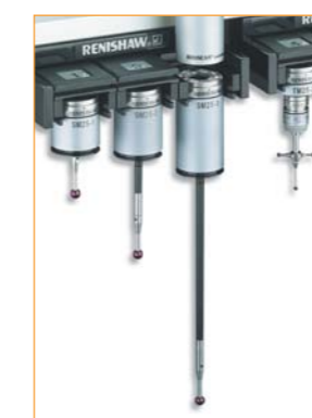
Die kinematische Befestigung ermöglicht schnellen und wiederholgenauen Modul- und Tastereinsatzwechsel