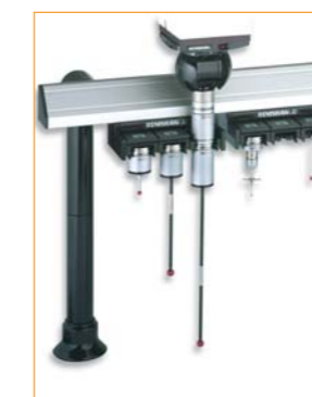
FCR25 Wechselssysteme, am MRS montiert