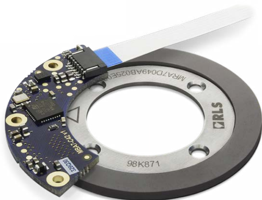
AksIM magnetisches, absolutes Winkelmeßsystem

Die Hauptwelle des Dreh- und Schwenkmoduls, die das Sonar um 10 Grad pro Sekunde drehen kann, passiert den Ring des RLS AksIM Winkelmeßsystems. Der magnetisierte Ring mit integriertem Codemuster berührt nicht den Rand des Abtastkopfes. „Berührungslos“ bedeutet, dass keine Reibung und somit kein Verschleiß auftreten – eine zuverlässige Lösung für ferngesteuerte Unterwasser-Anwendungen. Das RLS Winkelmeßsystem bietet eine Auflösung, die 10 Mal höher ist als für die Martech Anwendung vorgegeben wurde. Natürlich erfordert der Einsatz eines Sonars in bis zu 3000 m Tiefe einen robusten Stellantrieb, der in der Lage ist, hohen Druckbelastungen, kalten Temperaturen und hohen hydrodynamischen Kräften standzuhalten. Für diese rauen Umgebungsbedingungen entwickelte Martech eine besondere Gehäusekonstruktion. „Wir verwenden derzeit einen Halbleiteroszillator als Taktgeber und haben den Kristall weggelassen“, erklärt Paul Baxter. „Das war einfach zu machen und funktioniert sehr gut. RLS konnte auf unsere Erfahrungen zurückgreifen, um eine eigene Version des Drehgebers speziell für Hochdruckanwendungen zu entwickeln.“