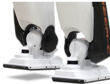
Rovnováha robota REEM-C na jedné noze mezi jednotlivými kroky

Pro řízení rovnováhy je do každého chodidla robota implementován zpětnovazební systém, který vypočítává bod nulové pohybové energie (ZMP). To je hodnota, kterou lze používat k vyhodnocení stability robotů, jako je REEM-C. Změřená hodnota ZMP je následně předána do řídicího systému PD s „fuzzy logikou“ pro sledování požadovaného ZMP, dosažení rovnováhy a zamítnutí rušení. Cílem řídicího systému je nastavit polohu těžiště robota tak, aby ZMP byl vždy uvnitř oblasti opory (pod chodidly). Úspěšná dynamická chůze po dvou nohách vyžaduje prostřednictvím zpětné vazby z rotačního enkodéru přesné řízení úhlů kloubů nohou, pokud jde o polohu, rychlost a zrychlení.