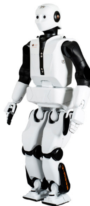
Plnohodnotný dvounohý humanoid REEM-C od společnosti PAL Robotics

Konstrukce, programování a montáž robotů jsou situovány v rušných kancelářích společnosti PAL Robotics v Barceloně, kde tým inženýrů neustále pracuje na rozvoji schopností jejich robotů.