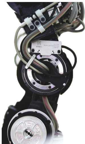
Kolenní kloub robota REEM-C s absolutním systémem rotačního

Jako vhodné řešení byly zvoleny bezkontaktní magnetické enkodéry od společnosti RLS, partnerské společnosti Renishaw. Mezi ně patří rotační enkodéry, např. AksIM™ a Orbis™, které jsou integrovány do kolenního kloubu (obrázek nahoře), zápěstí a lokte a jsou přírůstkovým systémem RoLin™ na úrovni součástí.