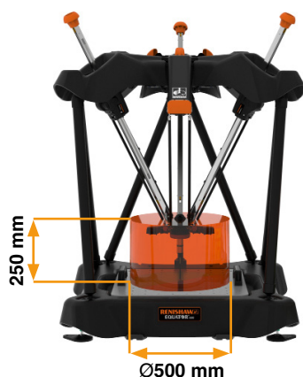
Equator 500 Standard Height