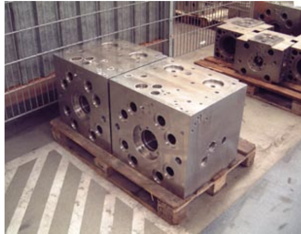
... zum „Schweizer Käse“: fertig bearbeiteter Zylinderdeckel mit allen Bohrungen für Ventile und Steuerung der Hydraulikhämmer

Atlas Copco nach einer besonderen Strategie. Zunächst werden die Rohlinge auf den Bearbeitungszentren gespannt und an allen Seiten plan gefräst. Dann erfasst ein Messtaster von Renishaw die genaue Aufspannlage. Mit den Daten korrigiert die CNC-Steuerung den Nullpunkt, damit anschließend eine zentrale Bohrung eingebracht werden kann. Nach der Lage dieser Bohrung richten sich alle anderen Bohrungen. Hier nun kommt der große Vorteil der Taster von Renishaw ins Spiel. Ehemals mussten die Fertigungsmitarbeiter zeit- und arbeitsaufwändig die Lage der zentralen Bohrung auf Genauigkeiten im Bereich von hundertstel Millimeter ermitteln. Inzwischen vereinfachen und beschleunigen Messtaster, wie der OMP60, diesen Vorgang erheblich. Sie werden wie ein Werkzeug aus dem Magazin der Bearbeitungszentren in die Hauptspindel eingewechselt. Durch Antasten von drei Punkten in der Bohrung erfasst die Steuerung der Maschinen deren Lage auf Genauigkeiten kleiner 0,01 mm. Die Messtaster übertragen optisch ihre Daten an das Empfängermodul OMI. Es ist im Arbeitsraum, meist oberhalb der Hauptspindel angebracht. Es ist weitgehend unempfindlich gegen Kühlwasser und Späne. Insbesondere in Bearbeitungszentren mit großen Arbeitsräumen setzt man wahlweise ein oder zwei Empfängermodule